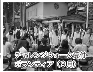
チャレンジウォーク受付 ボランティア (9月)