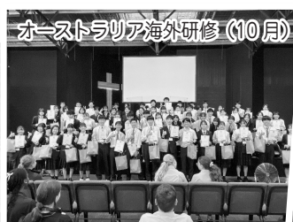
オーストラリア海外研修 (10月)