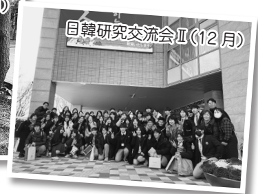
日韓研究交流会Ⅱ(12月)