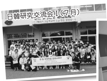
日韓研究交流会Ⅰ(7月)